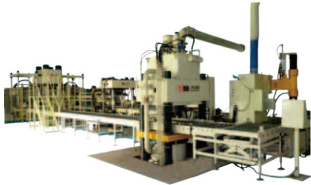
大同油壓精密沖壓成型柔性製造系統

在沉寂的市況下，雖然不少客戶減縮甚至取消訂單，卻是集團開拓新市場及尋找高端品質要求客戶的好時機。集團位於東莞及合肥的塑料加工生產基地，於回顧年度內積極拓展了新的高品質要求的客戶，並順利通過試產而開展了新業務，消除了過去客戶過分集中的風險。線路板業務於去年更進一步積極開拓新客戶和新市場，現時的客戶基礎更健全，該業務去年的業績亦回復增長。