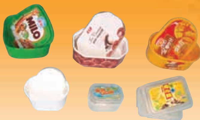
◀ 塑料衛生食品容器

於回顧年度內，塑料價格波動反覆，塑膠加工的成本控制困難，營業額下降，導致盈利降減。惟塑膠衛生食品容器業務經過整頓後，市場開展順利，預計其位於珠海市的新廠房可於本年中啟用，將為本集團業績帶來新貢獻。