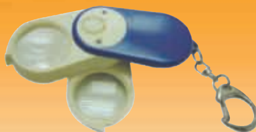
▲ 10倍防偽鈔帶燈塑料放大鏡