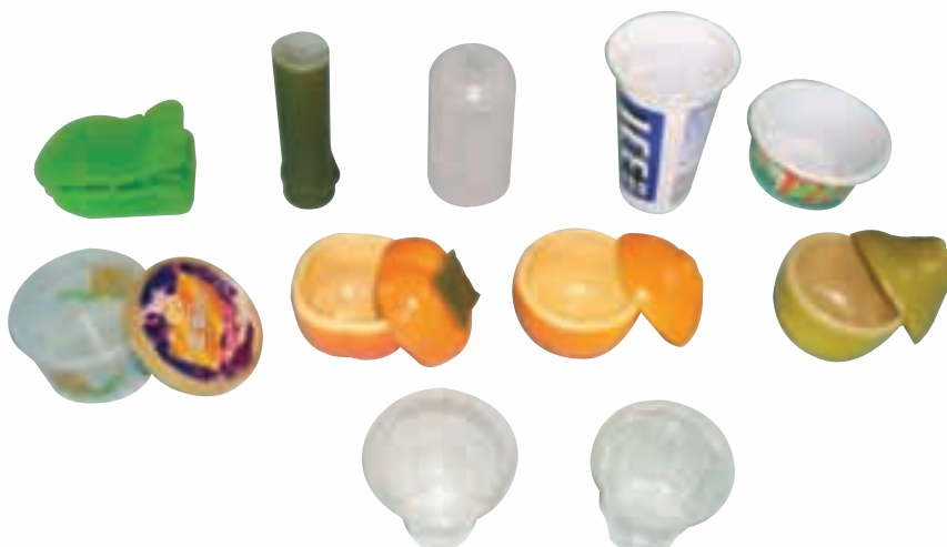
▲ 塑料衛生食品容器

於新一年度，預料塑膠材料價格將持續不穩，影響綜合利潤。我集團除積極拓展海內外市場外，將致力於加強質量及生產管理（包括採用合適的企業資源企劃管理軟體），以提高績效。