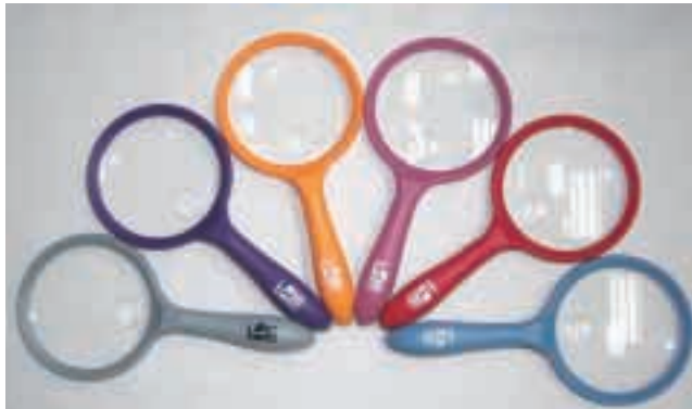
4吋直徑手握式帶燈放大鏡2x 4x

光學產品業務方面，於回顧年度內，本業務亦面對嚴峻的經營成本上漲問題。儘管如此，本業務在年度內採取了多項措施應付種種市場挑戰：於市務及銷售方面，增加直銷、電子商貿及展銷等推廣渠道；在產品發展方面，亦全面改善產品設計及豐富產品系列；在管理方面，致力改善生產流程，降低生產成本，業務的銷售額及盈利均有增長。