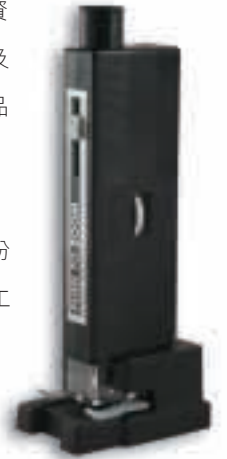
變倍帶燈顯微鏡(連座) 60x-80x-100x

於新的一年，集團仍將繼續致力於員工的培育，期望通過不斷的學習，使公司的核心競爭力得以提升，能為企業的持份者，帶來更理想的回報。