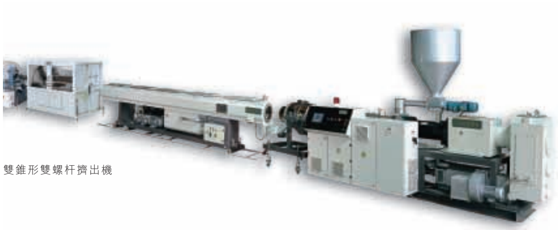
雙錐形雙螺桿擠出機